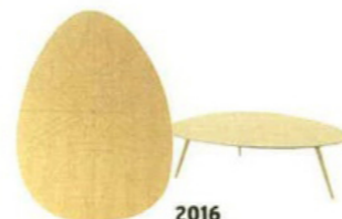
2016 Tavolo basso Nazca [Durame].