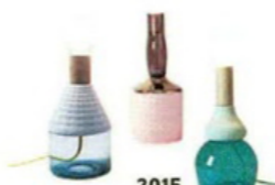
2015 Lampade MRDN [Seletti].