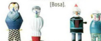
2018 Figurine Most Illustrious [Bosa].