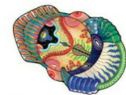
2020 Tappeto della collezione Space Escape [Moooi].

[IL 'PROGETTO' PIÙ RECENTE] È la nuova Summer Limited Edition di fazzoletti Tempo. Si chiama 'Le forme della Gentilezza': 6 pattern che rappresentano l'amicizia, l'amore, la condivisione, l'empatia, la natura e il rispetto [» tempo-world.com].