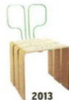
2013 Sedia Equations for dreamers [Elena Salmistraro Collection].

Una delle mie priorità è lo studio dell'armonia delle forme, ricercata nell'espressività degli oggetti, nell'animismo, nella poesia delle storie... L'emozione è a tutti gli effetti una funzione dell'oggetto, per me.