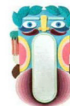
2019 Mobile appendiabiti Grifo [Altreforme].

Product designer e artista, vive e lavora a Milano. La cura per i dettagli è uno dei suoi mantra. I suoi lavori esprimono libertà creativa, eppure hanno tratti riconoscibili che li riconducono subito a lei. Come se lo spiega? «Ogni progetto ha un pezzo di me al suo interno e questo gli dà coerenza e riconoscibilità. Come per i Most Illustrious (i 4 'ritratti' in ceramica di De Lucchi, Castiglioni, Dalisi e Mendini, ndr), ogni designer è ciò che disegna. Nei miei lavori tornano spesso animali, mostri, dettagli naturali. E richiami alle tradizioni artigianali e all'arte». Uno dei suoi progetti più amati è quello dei Primates per Bosa. Come è nato? «Ho visto un documentario in tv sulle scimmie: colpita dai loro colori e dai volti, per un po' le ho disegnate. In estate poi ero a Ortigia e guardando le teste di Moro è nata l'idea. La tradizione siciliana mi ha