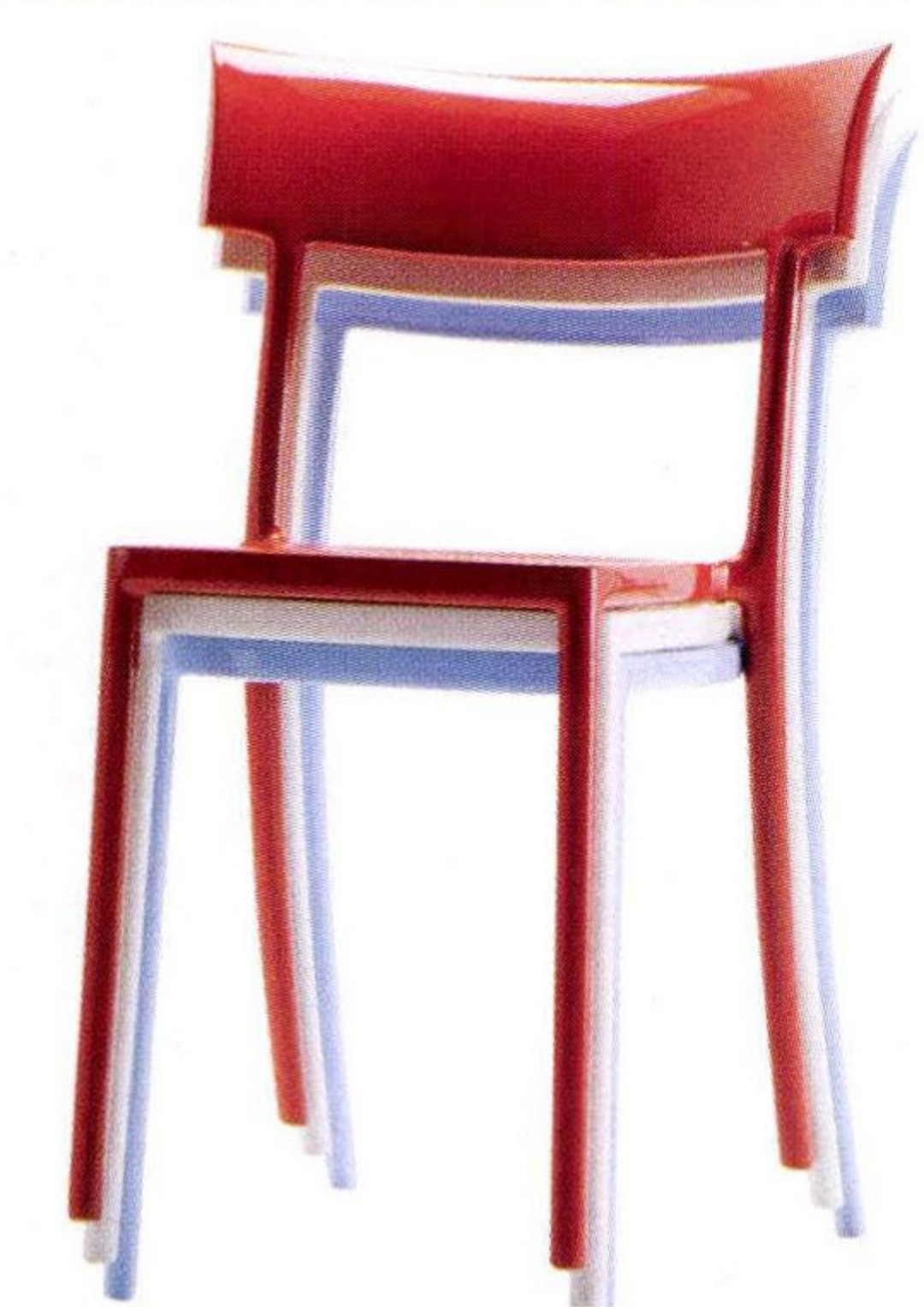
Ideata da Philippe Starck per Kartell, la sedia Catwalk interpreta la semplicità delle sedute pensate per le sfilate dell'haute couture. Très chic!