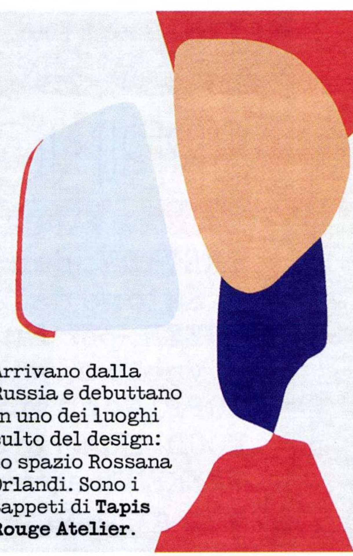
Arrivano dalla Russia e debuttano in uno dei luoghi culto del design: lo spazio Rossana Orlandi. Sono i tappeti di Tapis Rouge Atelier.