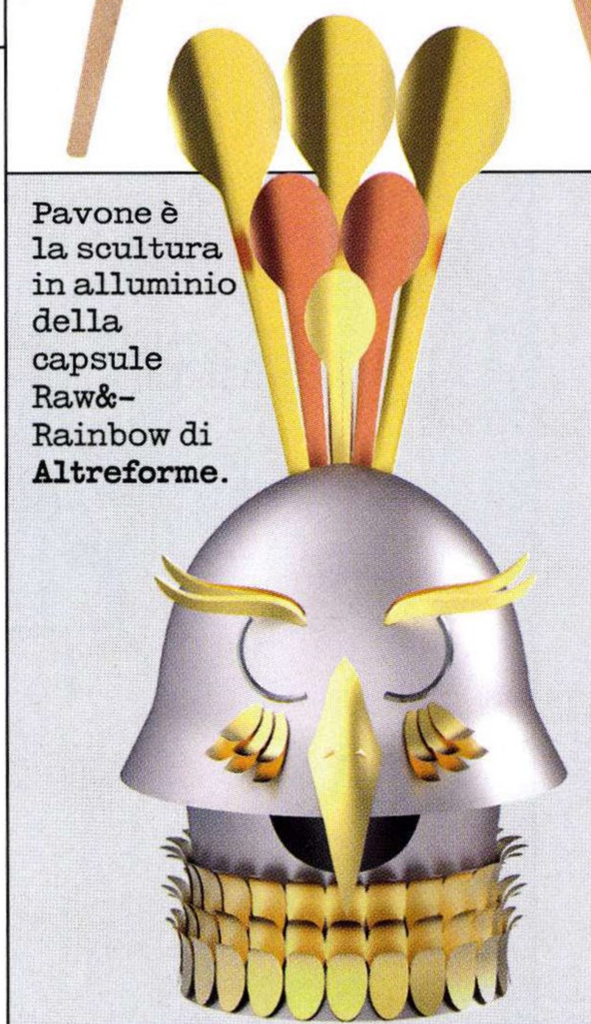
Pavone è la scultura in alluminio della capsule Raw&Rainbow di Altreforme.