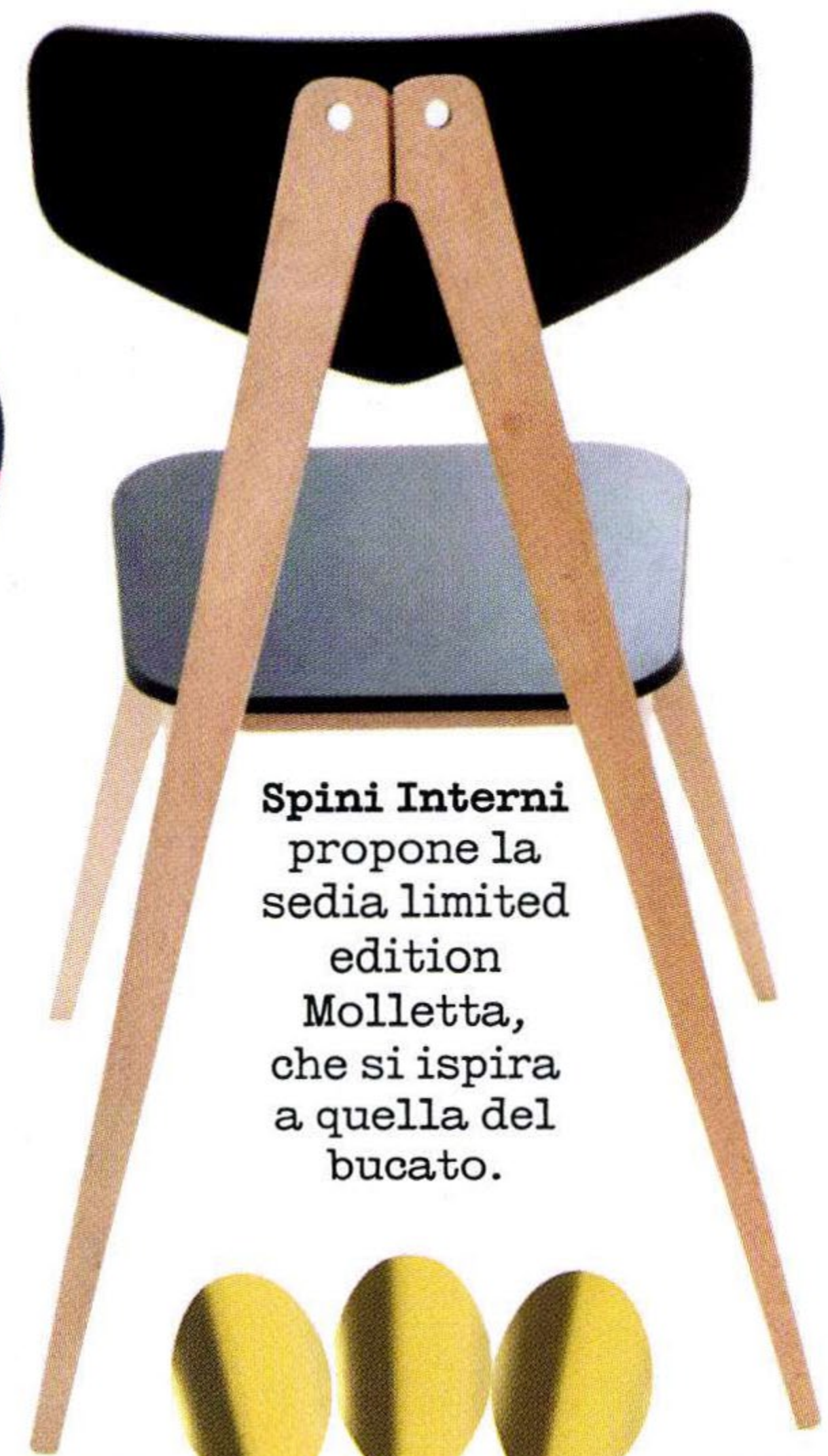
Spini Interni propone la sedia limited edition Molletta, che si ispira a quella del bucato.