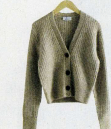
Van merino- en alpaca wol, & Other Stories, € 89. stories.com