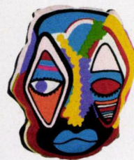
Knuffelbaar Pillow Mask van Kitsch Kitchen € 49,95. kitschkitchen.nl