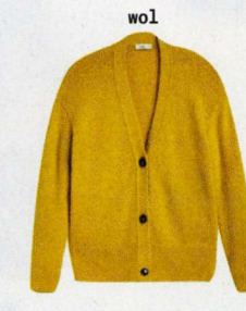
Van babyalpaca wol, Closed, € 299. closed.com