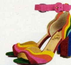
Suède Degratissimo's van Christian Louboutin, € 695