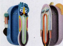
Spiegelkasten Mata en Grifo, € 30.500. altreforme.com