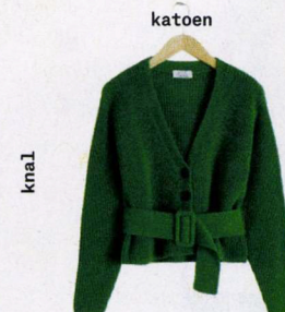
Met ceintuur, & Other Stories, € 69. stories.com

Het 'opavest' is (grof)gebreid en heeft grote knopen en een V-hals.