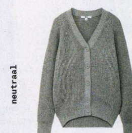
Met 5 procent kasjmier, Uniqlo, € 29,90. uniqlo.com