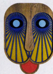
Houten masker uit de Modern African-collectie van Umasqu, € 195. klevering.nl